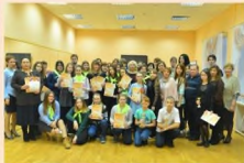
Участники фестиваля молодежной журналистики «Золотое перышко»