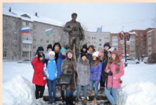
Посещение памятника журналистам «Жизнь за правду»