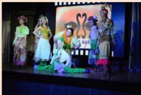
Коллекция «Бабушкин сундук» Выступление на конкурсе «Лучшая пара»

Театр моды в Центре работает с апреля 2016 года. За этот период подготовлены две новые коллекции, с которыми театр выступает на мероприятиях различного уровня.