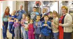
Выставка рисунков «Мы мир украсим яркой лентой», 25.03.2016 г.Тобольск. Воспитанники изостудии «Ультра»