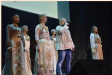
Коллекция «Русский костюм» Выступление на конкурсе «Песня России»