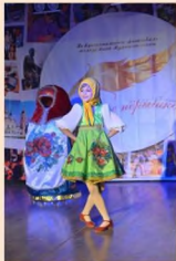
«Матрешка». Выступление на фестивале молодежной прессы «Золотое перышко»